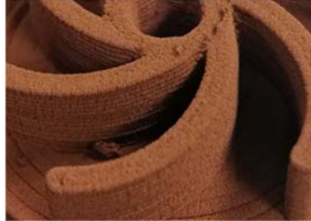
Zoom de una pieza en verde impresa con cobre reciclado

Durante el proyecto, que finaliza en 2021, se han realizado ciclos de recuperación/reciclaje/impresión de Residuos de Aparatos Eléctricos y Electrónicos (RAEE) con el fin de demostrar varios casos de uso de la tecnología desarrollada durante el proyecto.. También se ha realizado un workshop de formación en el uso de la tecnología DIW en colaboración con el Ateneo de Fabricación de la Fábrica del Sol de Barcelona.